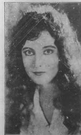
Betty Bronson, en "Peter Pan" que filma la "Paramount Pictures" bajo la dirección de Herbert Brenon.