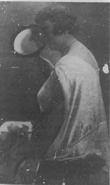
Eminente artista que es una de las estrellas de primera magnitud de la compañía Ba-Ta-Clan que actúa en el "Nacional".

Un concierto. El domingo 11 de enero próximo, ofrecerá un Concierto Vocal en el teatro "Nacional".