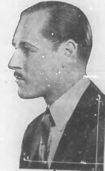
Jack Holt, estrella de la "Paramount Pictures".

La casa "Paramount", una de las más importantes firmas películas de Norte América prepara una hermosa y bella serie de películas para el nuevo año de 1925.