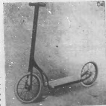
Patín desde $8.00, de San Rafael número 128. La casa de los señores Rodríguez y Compañía.

Un ponche fácil y muy sabroso para estos alegres días. En un ponche se eche el contenido de media docena de botellas de cerveza "Cabeza de Perro", amarilla, tres yemas de huevos bien batidas, ruedas finas de piña y limón, azúcar a discreción y póngase a helar sin echarle hielo dentro. Este ponche, una vez terminado, es de un color muy lindo de ámbar y al paladar exquisito.