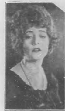
Betty Compson, protagonista insubstituíble de "La Hembra".