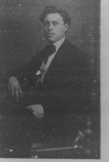
Reputado músico y compositor mexicano, que se encuentra de nuevo entre nosotros después de haber cosechado muchos laureos en su país natal.

El maestro RIVERA BAZ. Reputado músico y compositor mexicano, que se encuentra de nuevo entre nosotros después de haber cosechado muchos laureos en su país natal.