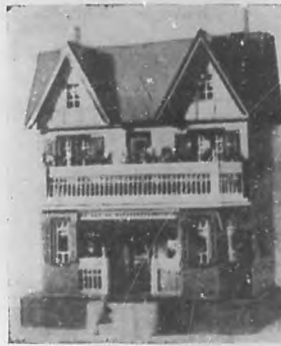
Casa de muñeca de "Los Reyes Magos", en varios precios.