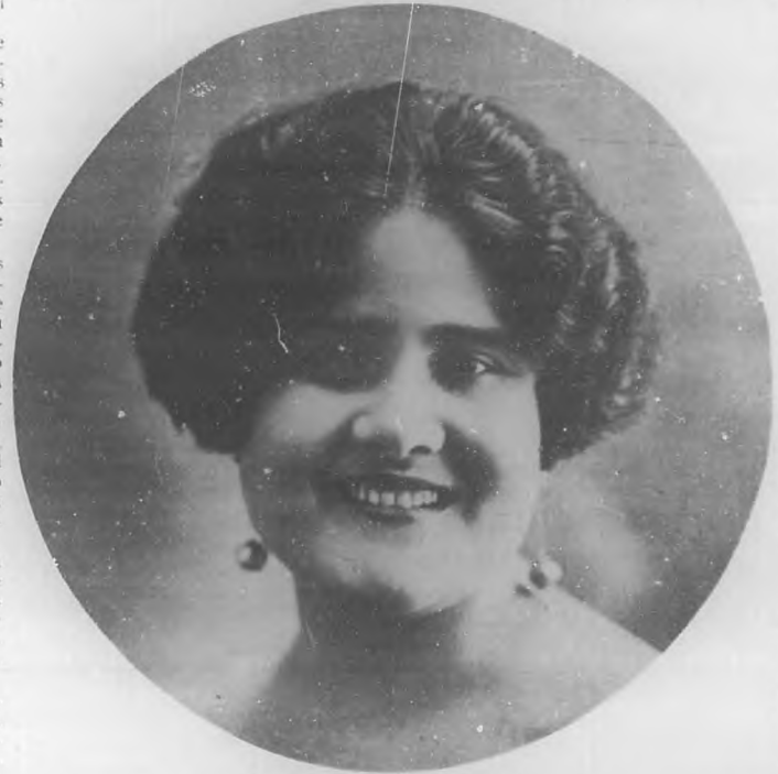
Gentil y notable soprano cubana, que próximamente ofrecerá un concierto vocal patrocinado por elementos muy distinguidos de la sociedad habanera